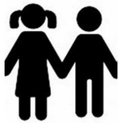
Frère ou sœur de Français