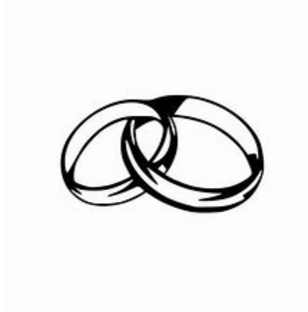
Conjoint de Français