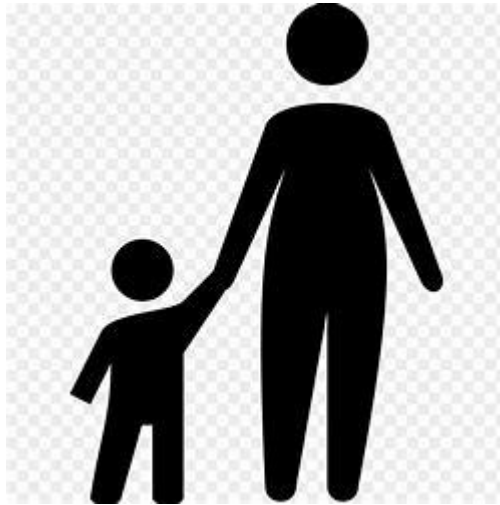
Ascendant de Français